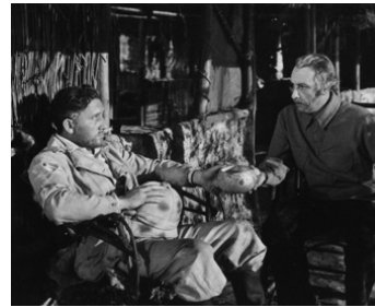
1939 STANLEY ET LIVINGSTONE (Stanley and Livingstone) de Henry King avec Spencer Tracy