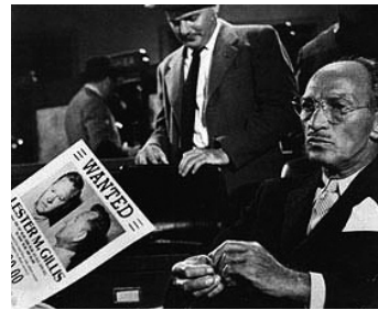
1957 L'ENNEMI PUBLIC (Baby Face Nelson) de Don Siegel avec Mickey Rooney