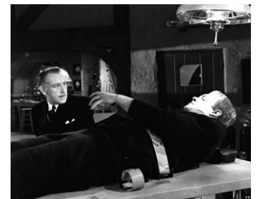
1942 LE SPECTRE DE FRANKENSTEIN (The Ghost of Frankenstein) d'E. Kenton avec B. Karloff