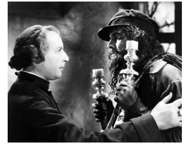
1935 LES MISÉRABLES (Les Miserables) de Richard Boleslawski avec Fredric March