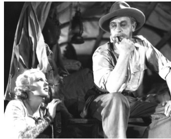
1937 LES MINES DU ROI SALOMON (King Solomon's Mines) de Robert Stevenson avec Anna Lee