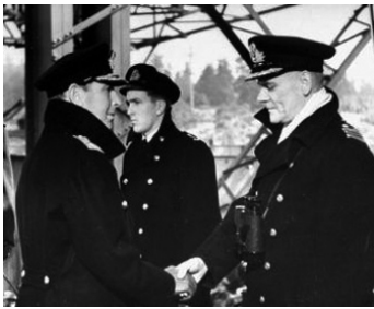
1942 LE COMMANDO FRAPPE À L'AUBE (Commandos strike at Dawn) de John Farrow