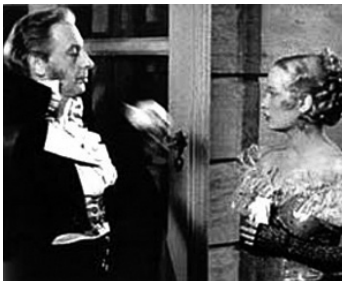
1935 BECKY SHARP (Becky Sharp) de Rouben Mamoulian avec Miriam Hopkins