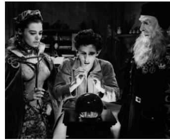
1956 DIANE DE POÏTTIERS (Diane) de David Miller avec Marisa Pavan