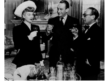
1947 DES FILLES DISPARAISSENT (Lured) de Douglas Sirk avec Lucille Ball, G. Sanders