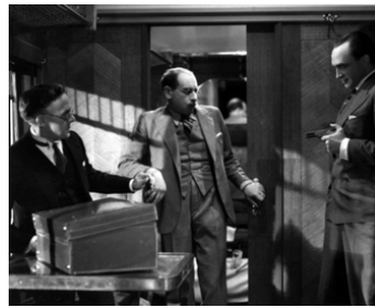
1932 ROME EXPRESS (Rome Express) de Walter Forde avec Eliot Makeham, Conrad Veidt