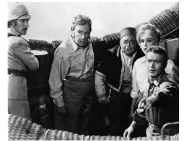
1962 5 SEMAINES EN BALLON (5 Weeks in a Balloon) d'I. Allen avec B. Eden, R. Buttons