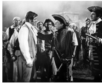
1952 LE TRÉSOR DES CARAÏBES (Caribbean) d'Edward Ludwig avec John Payne