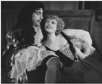
1934 NELL GWYN (Nell Gwyn) de Herbert Wilcox avec Anna Neagle