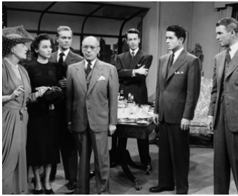
1948 LA CORDE (The Rope) d'Alfred Hitchcock avec J. Dall, J. Chandler, F. Granger, J. Chandler