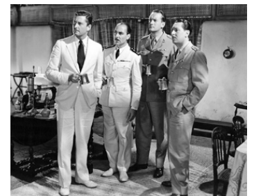
1941 CRÉPUSCULE (Sundown) de Henry Hathaway avec George Sanders