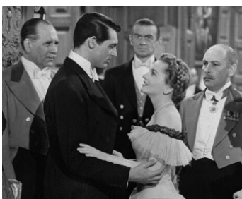
1941 SOUPÇONS (Suspicion) d'Alfred Hitchcock avec Cary Grant, Joan Fontaine