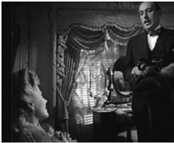
1947 LE CRIME DE MADAME LEXTON (Ivy) de Sam Wood avec Sarah Algood