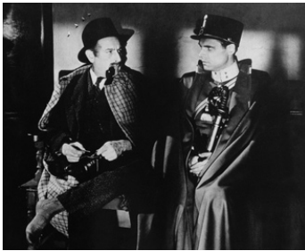
1946 AMOUR TRAGIQUE ((Beware of Pity) de Maurice Elvey avec Albert Lieven