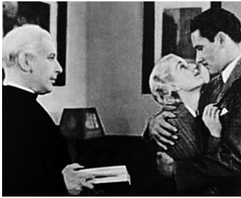
1937 LA LUMIÈRE VERTE (Green Light) de Frank Borzage avec Anita Louise, Errol Flynn