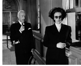
1948 VENGEANCE DE FEMME (A Woman's Vengeance) de Zoltan Korda avec Jessica Tandy