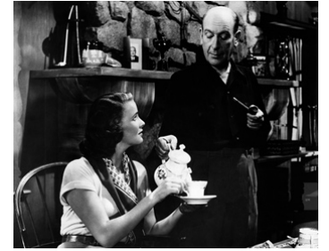
1950 LA TOUR BLANCHE (The White Tower) avec Ted Tetzlaff avec Alida Valli