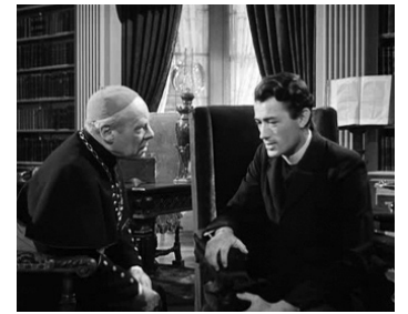
1945 LES CLÉS DU ROYAUME (The Keys of the Kingdom) de John M. Stahl avec Gregory Peck