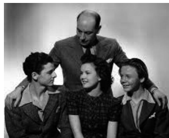
1940 TOM BROWN ÉTUDIANT (Tom Brown's Schooldays) de R. Stevenson avec F. Bartholomew