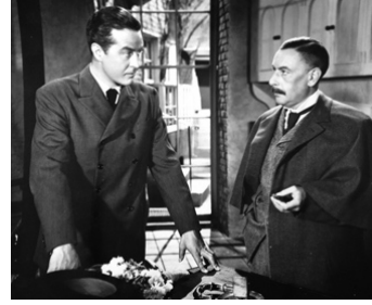
1947 SUPRÊME AVEU (The Imperfect Lady) de Lewis Allen avec Ray Milland