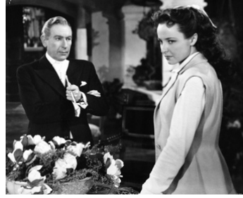
1947 TAÏKOUN (Tycoon) de Richard Wallace avec Laraine Day