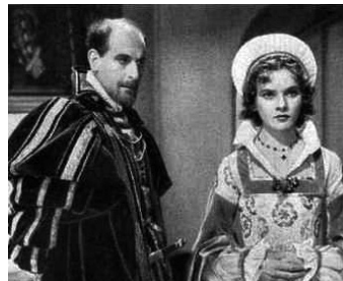
1936 MARIE TUDOR (Tudor Rose) de Robert Stevenson avec Nova Pilbeam