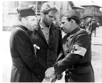
1943 LA CROIX DE LORRAINE (The Cross of Lorraine) de T. Garnett avec J-P. Aumont, H. Cronyn