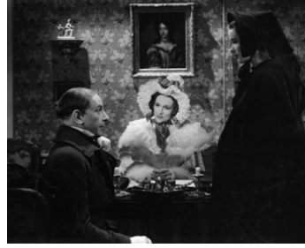
1947 NICHOLAS NICKLEBY (Nicholas Nickleby) d'Alberto Cavalcanti avec Ann Howes