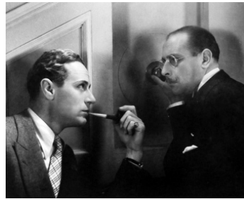
1934 THE LADY IS WILLING de Gilbert Miller avec Leslie Howard