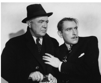
1940 LE RETOUR DE L'HOMME INVISIBLE (The Invisible Man returns) de J. May avec C. Kellaway