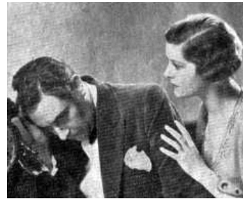
1934 LE ROI DE PARIS (The King of Paris) de Jack Raymond avec Marie Glory