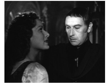
1939 QUASIMODO (The Hunchback of Notre Dame) de William Dieterle avec Maureen O'Hara