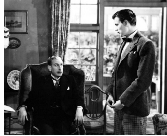
1948 THE WINSLOW BOY d'Anthony Asquith avec Jack Watling