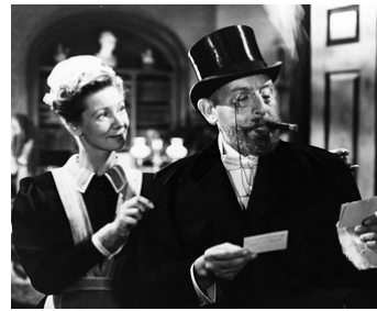
1944 JACK L'ÉVENTREUR (The Lodger) de John Brahm avec Doris Lloyd