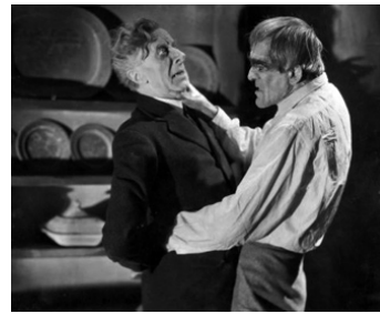
1933 LE FANTÔME VIVANT (The Ghoul) de T. Hayes Hunter avec Boris Karloff