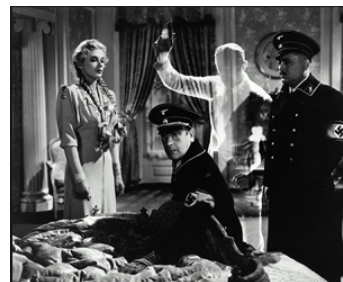
1942 L'AGENT INVISIBLE CONTRE LA GESTAPO (Invisible Agent) d'E. Marin avec I. Massey, J. Hall