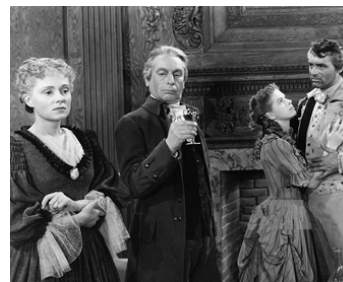
1940 HOWARD LE RÉVOLTÉ (The Howards of Virginia) de F. Lloyd avec M. Scott, C. Grant