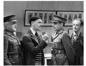
1934 LES ORDRES SONT LES ORDRES (Orders is Orders) de W. Forde avec James Gleason