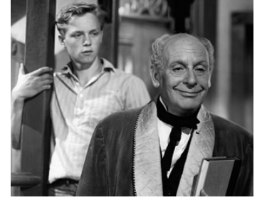
1948 TENDRESSE (I remember Mama) de George Stevens avec Steve Brown