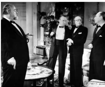
1956 LES GRANDS DE CE MONDE (The Power and the Prize) de H. Koster avec B. Ives, R. Erdman