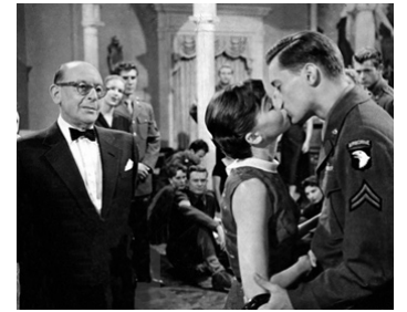
1956 GABY (Gaby) de Curtis Bernhardt avec Leslie Caron, John Kerr