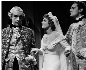
1935 PEG OF OLD DURY de Herbert Wilcox avec Anna Neagle, Jack Hawkins