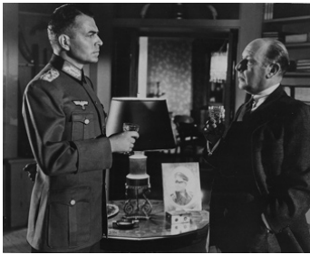
1951 LE RENARD DU DÉSERT (The Desert Fox) de Henry Hathaway avec James Mason